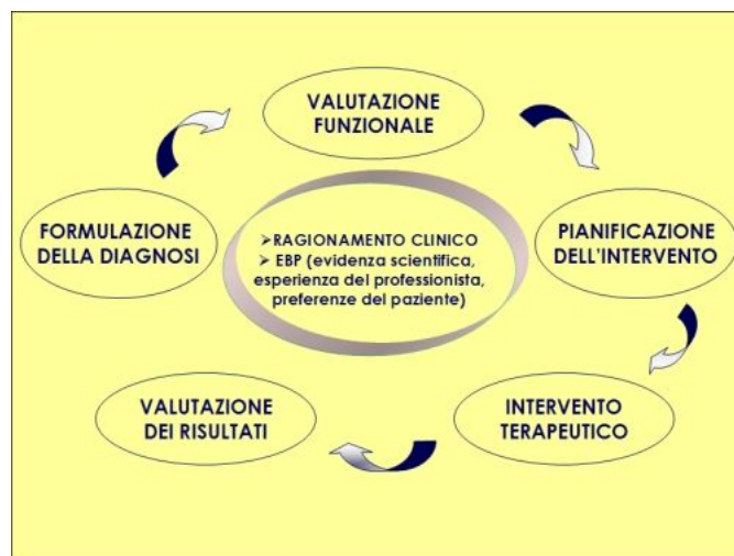
Figura 2. Modello sequenziale in fisioterapia: l'utilizzo di questa opzione terapeutica inizia con la considerazione della diagnosi, e prosegue con la valutazione funzionale, con la pianificazione del trattamento, con il trattamento e con la valutazione dei risultati. Tale utilizzo avviene all'interno di un processo di ragionamento clinico e alla luce della medicina basata sulle evidenze.